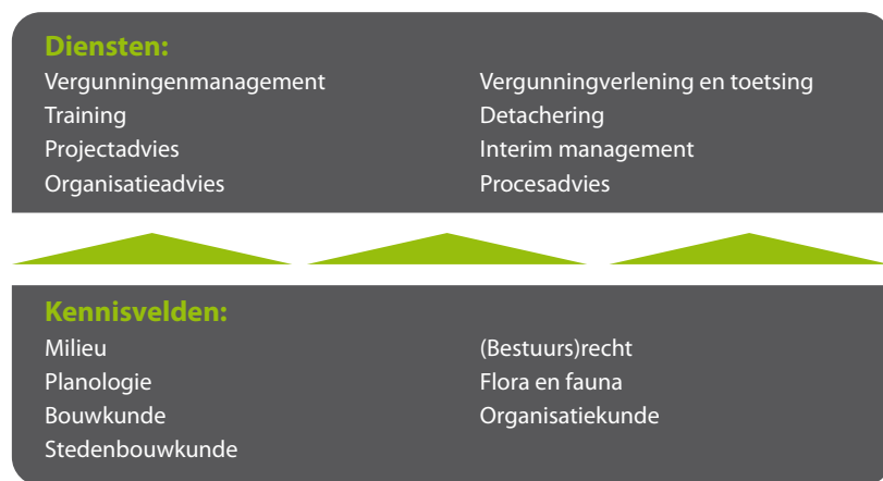
Figuur: Diensten Het Vergunningenhuis

Wij ondersteunen vergunningverlenende instanties én projectontwikkelaars bij alle vergunning gerelateerde activiteiten in de breedste zin van het woord. Wij verzorgen het vergunningmanagement rondom gebieds- en projectontwikkeling en leveren interim-management en capaciteit voor vergunningverlenende organisaties. Van het aanvragen of verwerken van de meest eenvoudige vergunning tot het inrichten van een organisatie die zich bezig houdt met vergunningverlening.