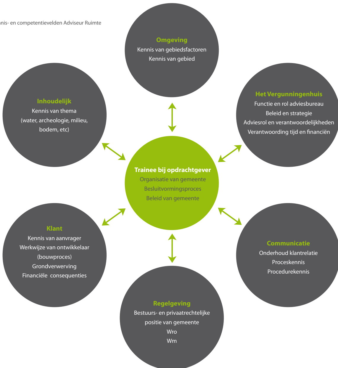
Figuur: Kennis- en competentievelen Adviseur Ruimte

Tijdens dit traineeship ben je 'Adviseur Ruimtelijke Ontwikkeling'. Deze functienaam omvat wat ons betreft de benodigde disciplines van ons werk, met als rode draad; ruimtelijke ontwikkelingen. Onze core business is vergunningmanagement voor gebieds- en projectontwikkeling. Om dit goed te kunnen doen heb je veel kennis, competenties en vooral ervaring nodig van die verschillende disciplines. In onderstaand schema is dit geïllustreerd.